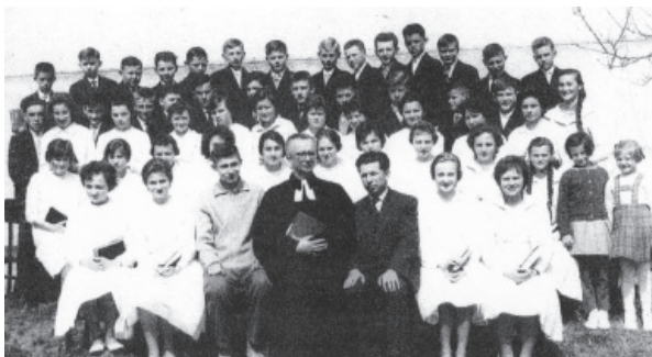
Pred 50 rokmi...

Jubilujúci konfirmandi po slávnostnom obede zotrvali v zborovom dome a zaspomínali na krásne chvíle spred 50-ich rokov.