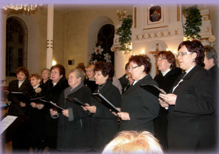
Zborový spevokol na Štedrý večer