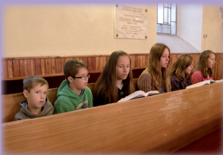
Pred požehnaním v kostole spievame