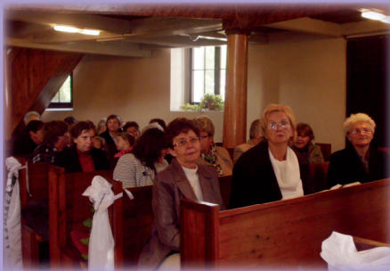
Sestry z nášho CZ na stretnutí SEŽ Považského seniorátu