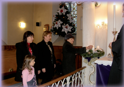
Štyri generácie rodiny Krecháčovej