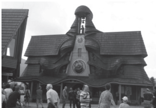
Slovenský orloj v Starej Bystrici

Slovenský orloj je najväčšia drevená socha, ktorá sa nachádza na území Slovenska. Celková kompozícia predstavuje sediacu Madonu, Pannu Máriu. Vo výklenkoch orloja je umiestnených 6 sôch slovenských dejateľov: Svätopluk, Pribina, Anton Bernolák, Ľudovít Štúr, Milan Rastislav Štefánik a Andrej Hlinka. Srdcom orloja je tzv. astroláb, teda ciferník s astronomickými údajmi. Práve astroláb robí zo Slovenského orloja v Starej Bystrici jediný a prvý orloj na Slovensku. Bez astrolábu nemôže byť orloj orlojom. Astronomické údaje sú špeciálne navrhnuté pre zemepisnú polohu Starej Bystrice, nejde teda o kópiu iného orloja. Farebnosť hlavnej dosky astrolábu je daná fázami dňa: čierna noc, červená úsvit, bledomodrá deň -obzor, červená súmrak. Ručička so slnkom sa pohybuje po týchto poliach podľa toho, kde sa reálne slnko nachádza. Hlavná doska astrolábu je ďalej delená zlatými lemovkami, ktoré označujú rovník, obratník raka, obratník kozorožca a tzv. miestny poludník, teda úsečku priamky, ktorá ukazuje kedy je slnko najvyššie na oblohe nad Starou Bystricou. Orloj v Starej Bystrici tak ako jediný z jestvujúcich orlojov na svete ukazuje tzv. pravý slnečný čas. Okrem toho astroláb ukazuje polohu mesiaca na oblohe, fázy mesiaca a polohu slnka v znamení zverokruhu. Na vonkajšom okraji je tzv. kalendárna doska, ktorá má 366 dielov a každý deň sa otočí o jeden diel. Významné slovenské sviatky a pamätné dni sú na kalendárnej doske označené červenou hviezdikou.