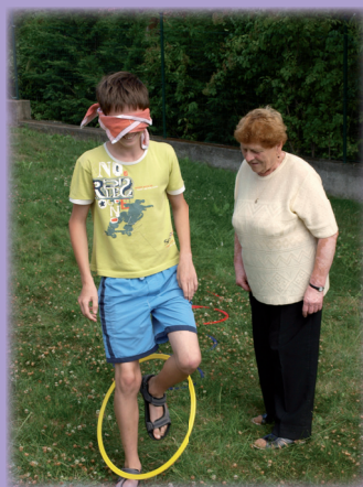
Stará mama Šikudová s vnukom