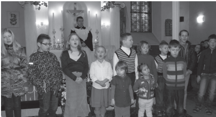
Kristus vstal z mŕtvych, Haleluja!

Aj nad tým sme uvažovali počas veľkonočných slávnostných služieb Božích. Počas tomu nenasvedčovalo, veď Veľkú noc pod snehovou perinou už dávno nik z nás neprežíval. Napriek tomu nás vo vnútri hrialo teplo Božej lásky.