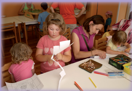
Tvorivé dielne detí